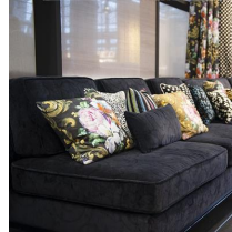
Messe Frankfurt Exhibition GmbH