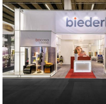
Messe Frankfurt Exhibition GmbH